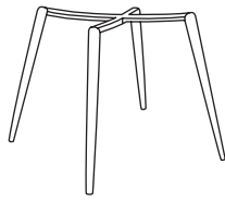
B x 1