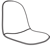
A x 1